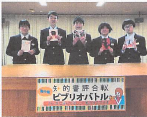
上の写真は昨年度のものです